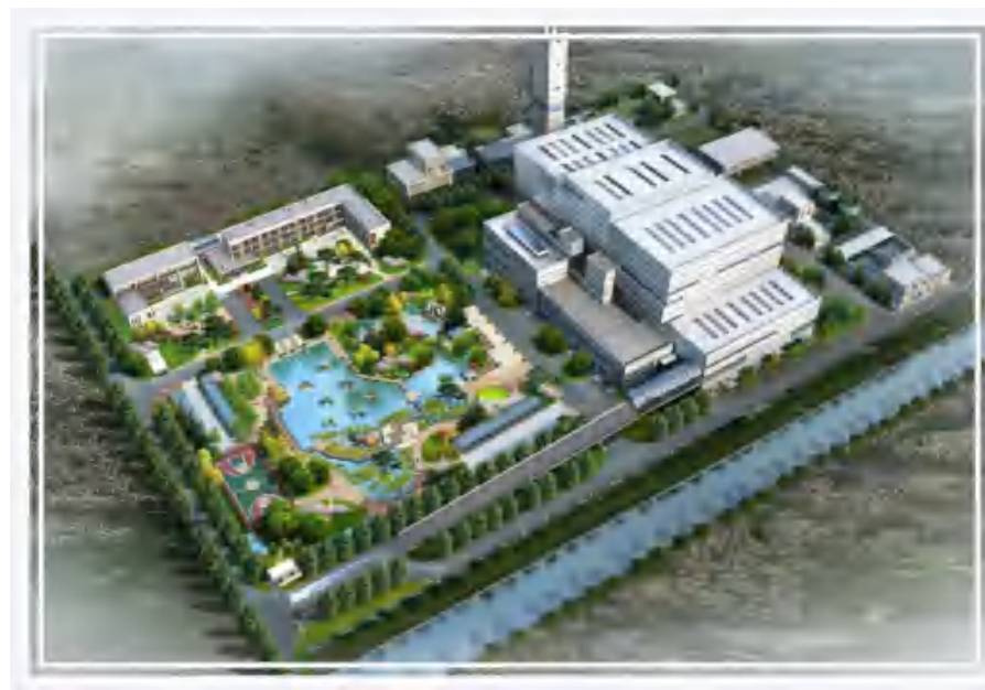
生活垃圾焚烧发电厂