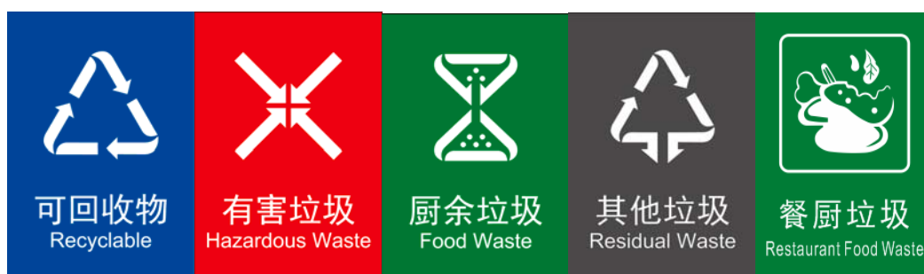
图 2. 大类、小类组合标志设置方案（印刷式）示例