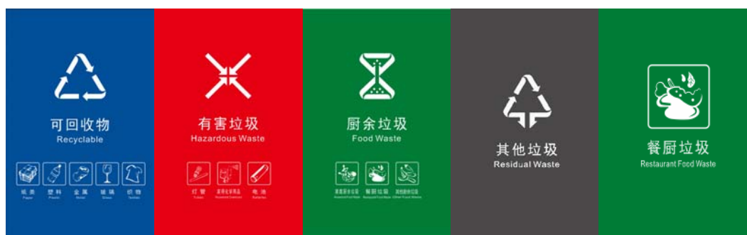
图 3.独立大类标志设置方案（附着式）示例