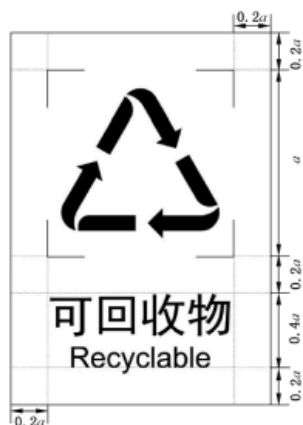
图 5 竖式图文组合标志尺寸

说明：①标准分类收集容器应采用标志尺寸：120L（容器尺寸 540mm*460mm*600mm），标志尺寸 270mm*405mm；240L（容器尺寸 720mm*600mm*950mm），标志尺寸 300mm*450mm。