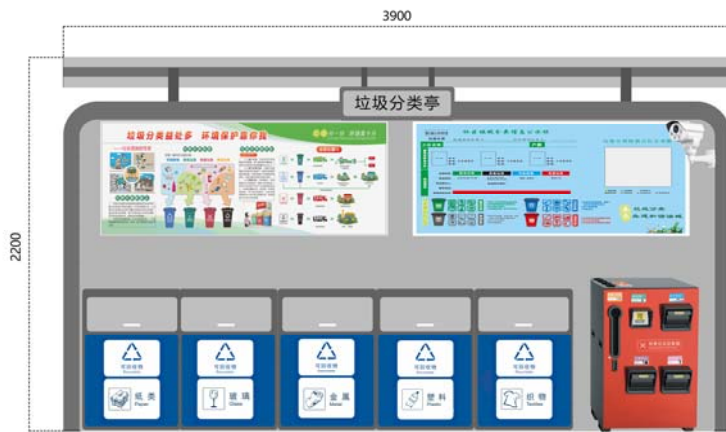
图 2.居住区分类回收小屋隔断