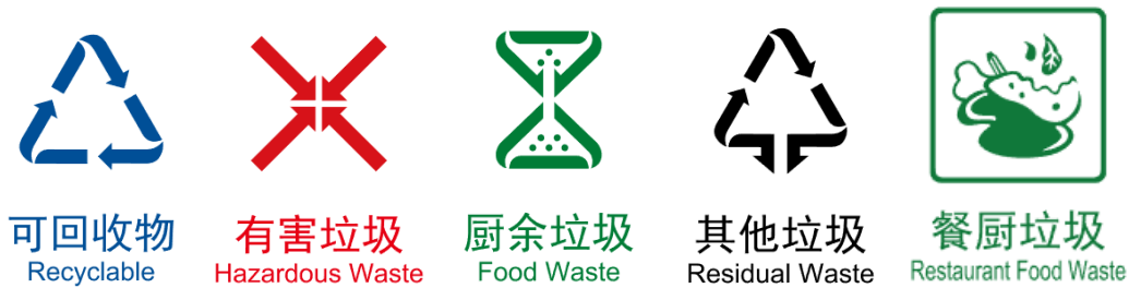
图 4. 大类、小类组合标志设置方案（附着式）示例